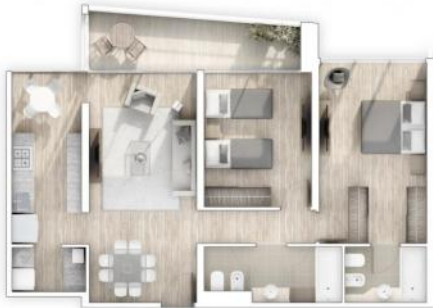
Brisa - Av. Ávellaneda y Génova