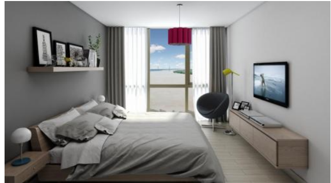
Brisa - Av. Ávellaneda y Génova