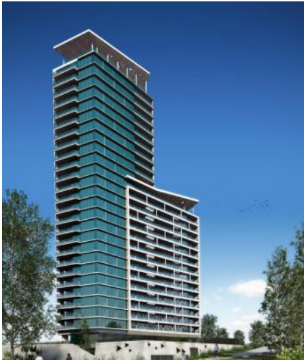
Brisa - Av. Ávellaneda y Génova