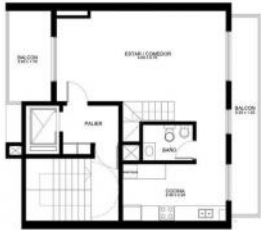
PLANTA PISO 11 / DUPLEX ESC. 1:100