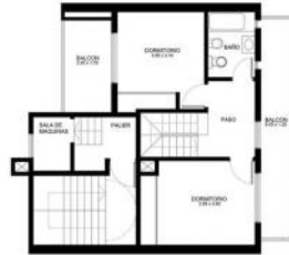
PLANTA PISO 12 / DUPLEX