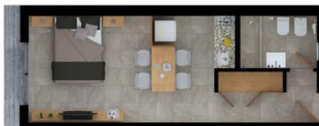
IMAGENES Y MEDIDAS NO CONTRACTUALES

+ Equipamiento y Terminaciones. Muros dobles con cámara de aislamiento térmica, terminación exterior en ladrillo visto junta entrasada. Fachadas en hormigón visto. Paredes y cielorraso en yeso proyectado y/o placas - y enduido pintado al látex. Pisos tipo porcelanato en piezas tamaño mediano-grande. Carpinterías de aluminio alta prestación con vidrios laminados de seguridad. Carpinterías interiores con marco madera y hojas de puertas placas enchapadas pintadas. Baños con revestimientos tipo porcelanato. Grifería mono-comando y válvula de descarga. Artefactos sanitarios Roca o similar, espejo y accesorios. Cocina con revestimientos cerámicos tipo porcelanato. Mesada de granito, piletta en acero inoxidable. Grifería mono-comando y conexiones completas para lavavajillas. Muebles bajo mesada y alacenas. Anafe a gas y termo-tanque eléctrico. Frente de placares en Placas en MDF. Instalaciones de agua, pluvio-cloacales y gas de primera calidad. Instalación eléctrica para iluminación LED y consumos intensivos de AA. Instalación de canalizaciones para internet-cable-telefonía. Instalación de cableado independiente, pases de muros y desagües a red para AA.