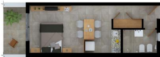
IMAGENES Y MEDIDAS NO CONTRACTUALES

+ Equipamiento y Terminaciones. Muros dobles con cámara de aislamiento térmica, terminación exterior en ladrillo visto junta entrasada. Fachadas en hormigón visto. Paredes y cielorraso en yeso proyectado y/o placas - y enduido pintado al látex. Pisos tipo porcelanato en piezas tamaño mediano-grande. Carpinterías de aluminio alta prestación con vidrios laminados de seguridad. Carpinterías interiores con marco madera y hojas de puertas placas enchapadas pintadas. Baños con revestimientos tipo porcelanato. Grifería mono-comando y válvula de descarga. Artefactos sanitarios Roca o similar, espejo y accesorios. Cocina con revestimientos cerámicos tipo porcelanato. Mesada de granito, piletta en acero inoxidable. Grifería mono-comando y conexiones completas para lavavajillas. Muebles bajo mesada y alacenas. Anafe a gas y termo-tanque eléctrico. Frente de placares en Placas en MDF. Instalaciones de agua, pluvio-cloacales y gas de primera calidad. Instalación eléctrica para iluminación LED y consumos intensivos de AA. Instalación de canalizaciones para internet-cable-telefonía. Instalación de cableado independiente, pases de muros y desagües a red para AA.