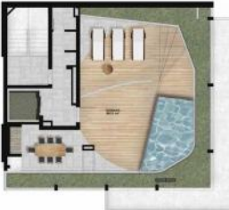
Información no contractual. No debe ser el único criterio para decidir sobre la compra.

Área de estar compartida con pasillo y plaza