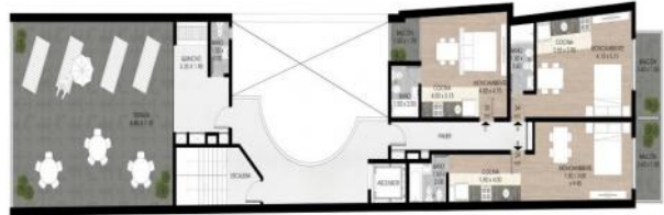
PLANTA 5º PISO