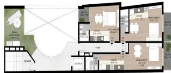
PLANTA 6° PISO