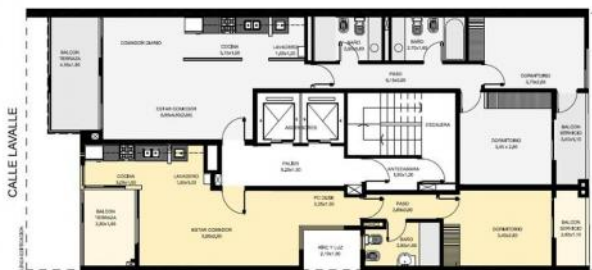
PLANTA TIPO. NIVELES DESDE 2º A 12º

SEMPISOS: DEPARTAMENTO DE 2 DORMITORIOS DEPARTAMENTO DE 1 DORMITORIO