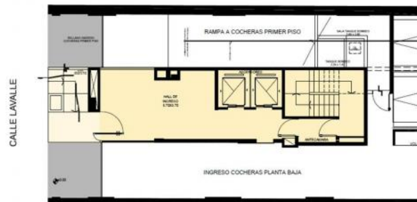
PLANTA BAJA. NIVEL DE INGRESO

COCHERAS: 12 COCHERAS EN PLANTA BAJA 12 COCHERAS EN 1º PISO (ACCESO A TRAVÉS DE RAMPA DE HORMIGÓN)