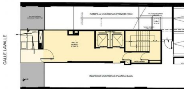
PLANTA BAJA. NIVEL DE INGRESO

COCHERAS: 12 COCHERAS EN PLANTA BAJA 12 COCHERAS EN 1º PISO (ACCESO A TRAVÉS DE RAMPA DE HORMIGÓN)