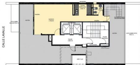
PLANTA TIPO. NIVELES DESDE 2º A 12º