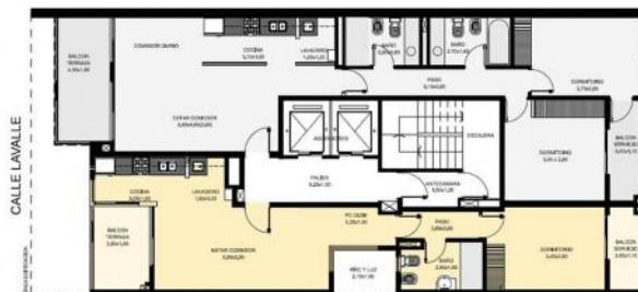
PLANTA TIPO. NIVELES DESDE 2º A 12º

SEMPISOS: DEPARTAMENTO DE 2 DORMITORIOS DEPARTAMENTO DE 1 DORMITORIO