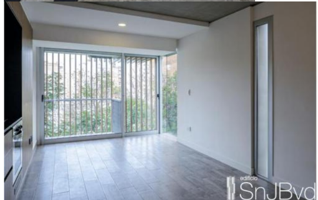
Ambiente Único | Unidad A Monocambiente (2do a 7mo)