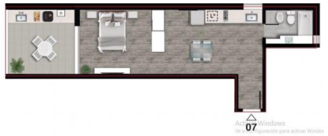
PISO 11° AZOTEA