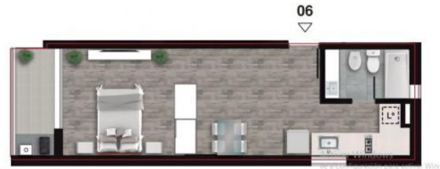
PISO 11° AZOTEA