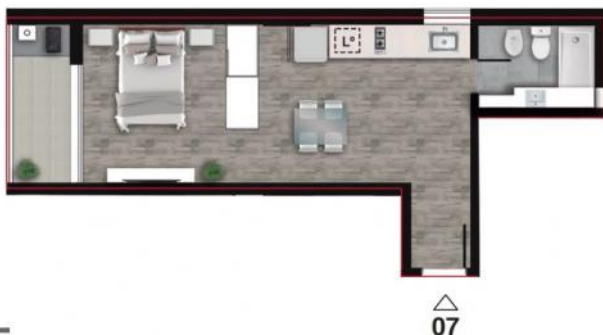
PISO 11° AZOTEA