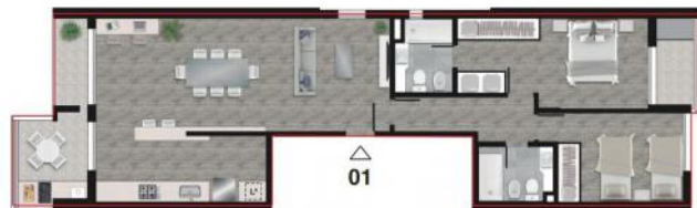
PISO 11° AZOTEA