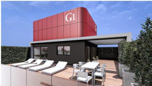
PISO 11° AZOTEA