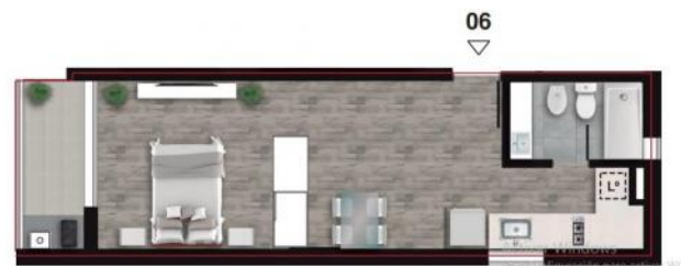
PISO 11° AZOTEA