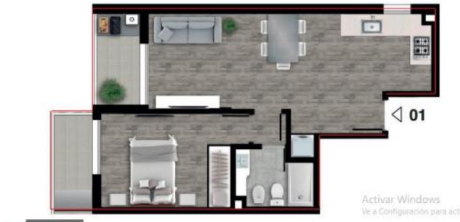
PISO 11° AZOTEA