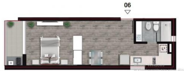
PISO 11° AZOTEA