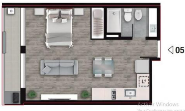
PISO 11° AZOTEA