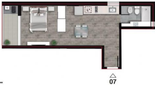
PISO 11° AZOTEA