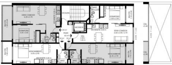
PLANTA 4º/5º/6º/7º/8º/9º PISO