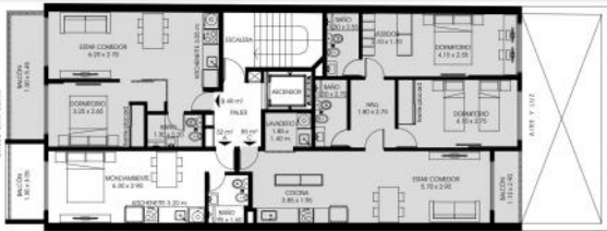
PLANTA 2º PISO