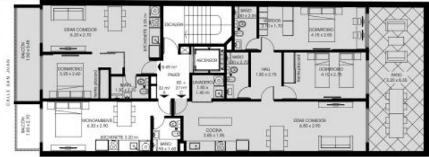
PLANTA 1º PISO