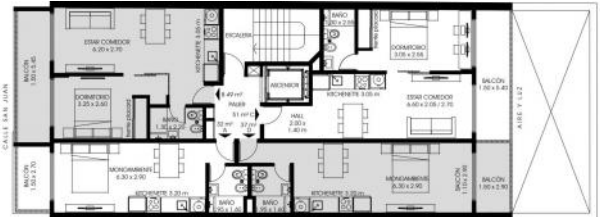
PLANTA 3º PISO