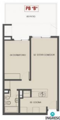
PLANTA BAJA. UNIDAD B