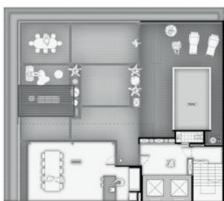
TERRAZA PISCINA ESPACIO RELAX QUINCHO CON PARRILLO