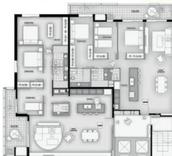
U01 Sup. Cubierta 122m 2 Sup. Balcon 74m 2