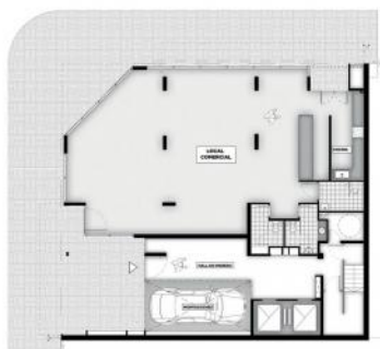
LOCAL COMERCIAL COCINA 3 BAÑOS