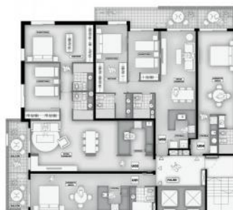
U01 Sup. Cubierta 33m 2 Sup. Balcon 6m 2 U02 Sup. Cubierta 50m 2 Sup. Balcon 12,50m 2